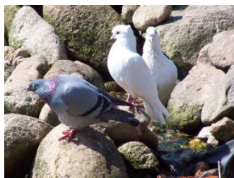
De duiven badderen graag in de waterval...

D e meeste duiven die hier rond de boerderij vliegen komen uit Delft, van een vogelopvang waar we regelmatig dieren voor opvangen, aangezien deze opvang voor wilde dieren