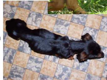
Onder Daksi toen ze ziek was, boven weer gezond met Lizzy aan het spelen...

kinderen hebben we kunnen plaatsen op goede adressen, deze pups hebben tenslotte nog een heel leven voor zich. Normaal gesproken plaatsen we geen dieren uit, we nemen de dieren namelijk alleen op als een andere