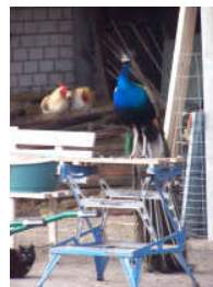
Werk in uitvoering... Jeroen Pauw helpt mee