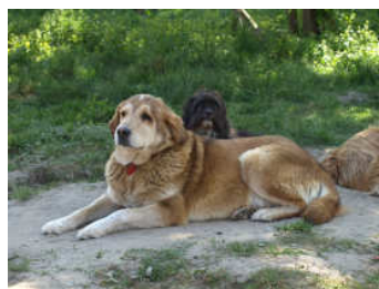
De rustige Panthera...

rug. Panthera is zo mishandeld geweest dat haar schedel misvormd is en er een oog ontbreekt. Aangezien deze honden nogal een verleden hebben, bleken ze onplaatsbaar te zijn. Het asiel waar deze honden verbleven werd gesloten, de overige honden werden door andere asielen overgenomen, maar een aantal honden waaronder dit drietal niet. De beheerder liet de dieren achter en een bezorgde buurvrouw nam de zorg over de 6 overgebleven dieren over. Echter op 15 maart jl. zouden de dieren worden afgemaakt. Drie andere diervrienden en wij vonden dat dit niet mocht gebeuren en hebben voor 3 van de 6 een goed onderkomen kun-