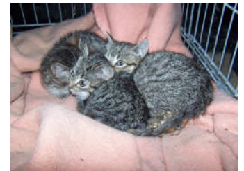
De doodsbange kittens...

Graag willen we nog, naast de donateurs en adoptiefouders, een aantal anderen bedanken voor hun bijzondere steun: