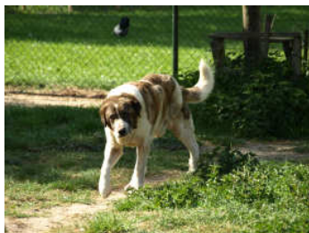
De kolos Lolo...

D it trio honden hing een hele donkere wolk boven de kop. Jarenlang hebben deze