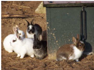
De onverwachte uitbreiding...

A an de deur stond een vrouw met twee konijnen in een plastic curverbox. De mevrouw vertelde al een hele tijd rond te rijden met de dieren, echter niemand wilde ze hebben. We waren haar enige hoop, anders zou ze de dieren in het bos moeten lozen en dat wilde ze eigenlijk ook niet. De twee konijnen werden hier achtergelaten, kort daarna werden we (onaangenaam) verrast, de voedsters hadden jongen gehad. Je vangt twee dieren op, maar eigenlijk waren het er dus 7!!!