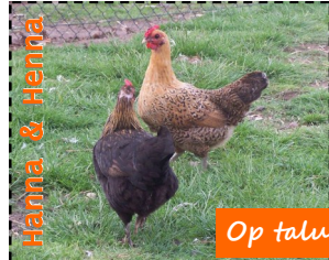
Hanna & Henna