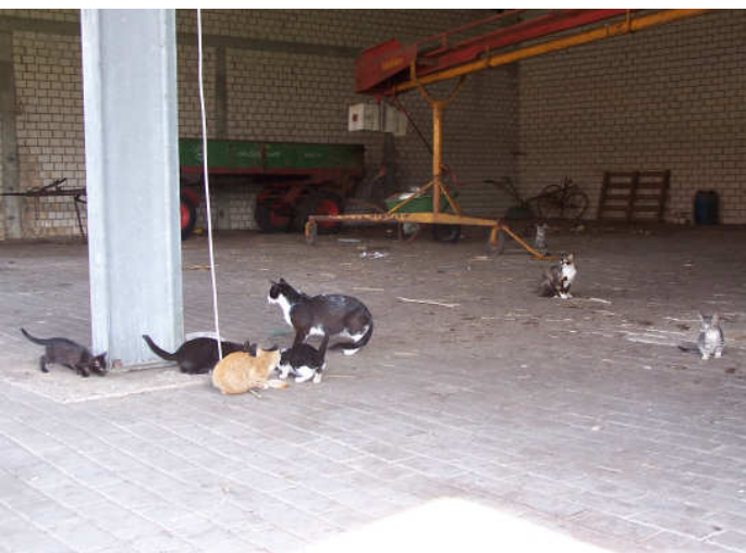
...ongeveer 8 van de 42!

◆ Tip: Heeft u deze nieuwsbrief gelezen? Gooi hem niet weg maar geef hem door! ◆