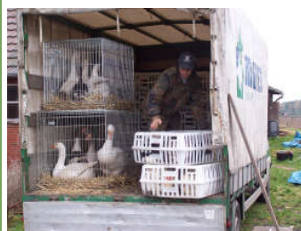
Het vervoer van de kippen, hanen, ganzen en eenden...

Onderweg is een aantal malen gestopt om te luchten en te controleren of de dieren het goed maakten. In Sögel aangekomen en uitgeladen bleek dat iedereen de reis goed doorstaan had. Het was een genot voor het oog om de dieren te zien genieten in hun nieuwe ruime verblijven.