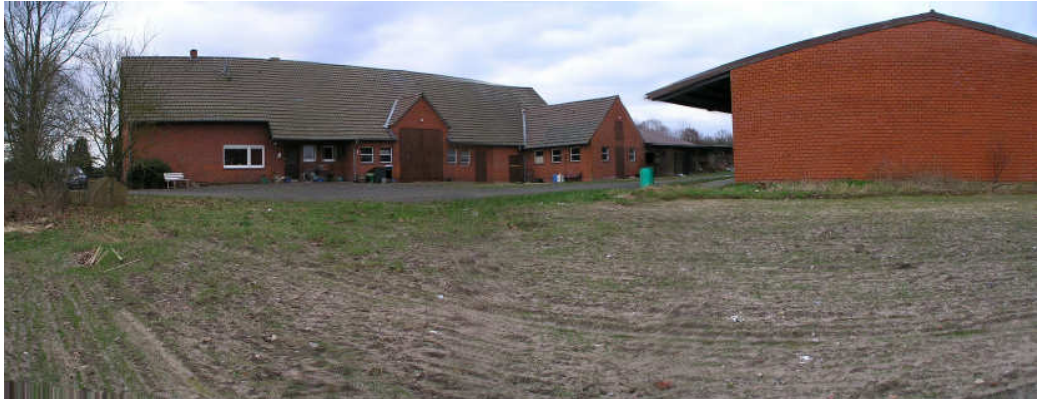
Het nieuwe onderkomen van Stichting Melief: Gnadenhof Sögel, met op de voorgrond een heel klein stukje van het ingezaaide gras. Meer foto's zijn te zien op http://www.huisinuitsland.com/Stichting/stichting.htm

open dag of bent u eerder in de buurt, dan bent u van harte welkom voor een bezoek. Belt u dan wel even van te voren voor een afspraak: 0049-(0)5952-200657.