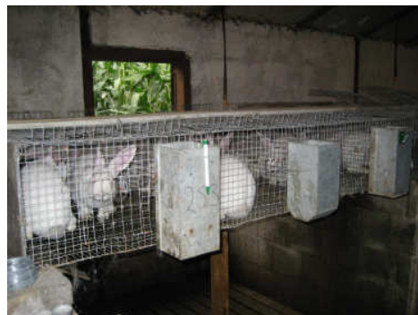
de hobby van een 16-jarige jongen...

drinknippel en voer en meer is niet vereist. Het zijn overigens niet alleen de vleeskonijnen die zo gehuisvest worden, steeds vaker fokken particulieren onder deze omstandigheden raskonijnen voor de verkoop in dierenwinkels. Al jaren is bekend dat wildhandels zich ook in laten met dergelijke praktijken en zoals in dit geval zelfs particulieren de opdracht geven om wilde konijnen in deze draadgazen gevangenissen te fokken voor de verkoop in hun zaak. De klant koopt zogezegd een wild konijn, dat dit dier onder erbarmelijke omstandigheden heeft geleefd en nooit daglicht of gras heeft gezien wordt er natuurlijk niet bij verteld.