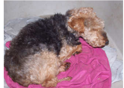
Assie de Welsh-Terriër

Assie is een welsh-terriër die hier sinds anderhalve maand verblijft. Via de honden uitlaatservice waar ze vaak verbleef is ze hier gekomen. Haar vorige eigenaar had haar op 6-jarige leeftijd in huis genomen omdat Assie een afgedankt product van een broedfokker was. Een goede daad van de vorige eigenaar, helaas wilde deze de zorg voor Assie niet tot het einde volbrengen. Reden hiervoor was de aanschaf van een nieuwe woning en het soms niet meer op kunnen houden van de urine door Assie. Volgens de voormalige eigenaar een onmogelijke combinatie met maar één uitweg, inslapen bij de dierenarts. Heeft Assie daar nu veertien jaar voor moeten worden, om vervolgens gezond ge euthanaseerd te worden... Gelukkig heeft degene van de uitlaatservice Assie aan een nieuw onderkomen geholpen bij Stichting Melief. Assie kan hier nog lekker van haar laatste (hopelijk nog) jaren genieten.