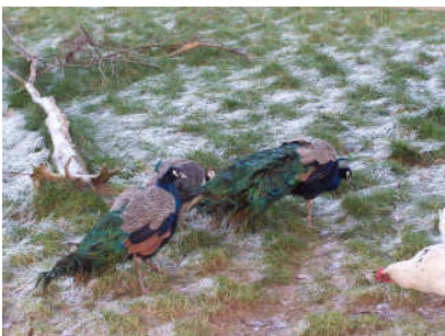
de pauwen met z'n drieën