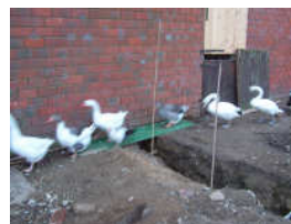
Werk in uitvoering... de dieren passen zich aan