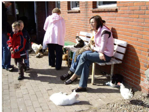
Mensen en dieren genoten zichtbaar van het samenzijn

Iedereen heeft op zijn of haar gemak tussen de dieren rondgelopen en alles rustig kunnen bekijken, al dan niet onder het genot van een hapje en een drankje. De reacties waren over het algemeen genomen positief, er waren zelfs een aantal mensen die gelijk aanboden vrijwilligerswerk te willen komen doen, van wie er al een aantal ook daadwerkelijk begonnen zijn. We kijken met een goed gevoel terug op deze eerste open dag in Duitsland en hopen dat het volgend jaar weer zo'n succes zal zijn.