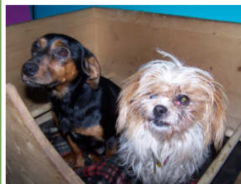
de gedumpte dames...

Toevallig ging Lothar die avond boodschappen doen en zag het wanhopige twee-