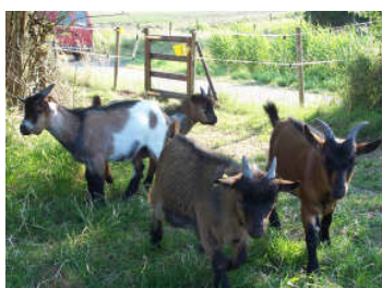
Help ons allemaal mee een nieuwe locatie te vinden!!!