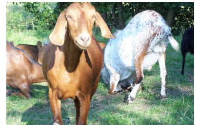
De 'knielende' geiten

In ons vorige nummer stond dat we een weide aangeboden gekregen hadden en dat het hoofdkantoor van de Dierenbescherming met drie zwaar verwaarloosde Nubische geiten in de maag zat. Deze dieren lopen, (althans dit gaat steeds beter) inmiddels op de weide. Net als vier bokjes die gered zijn van de slacht, een ooi met zoon waarvan de hoef zonder verdooving afgesneden is en vier schaapjes waar eindeloos mee gezeuld is. De drie Nubische geiten hebben nooit hoefverzorging gehad waardoor ze als het ware op blokhakken liepen, dit is zo pijnlijk waardoor ze op de knieën zijn gaan lopen. De hoeven worden intensief bekapt en het lopen gaat stukje bij beetje beter. De geiten en schapen kunnen nog steeds op afstand geadopteerd worden. Wimmie, het rammetje met de verminkte achterpoot is inmiddels geadopteerd door Sano Promotions ( www.sano-promotions.nl )!