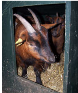
Onder andere Nina en Pippi komen van de dierenwei

ren en zouden er geen nieuwe dieren aangekocht worden. De afspraken worden niet nagekomen en het laatste woord is hier dan ook nog niet over gezegd. Wist u trouwens dat op bijna alle kinderboerderijen de jonge die-