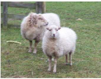
Vera en Dolly