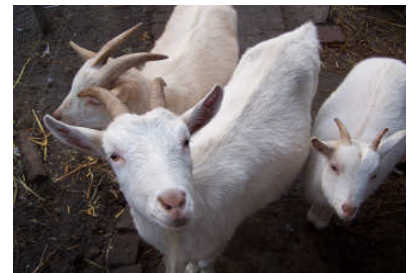
Melief met Veerle en Pepijn

Een geit heeft de pest aan regen en moet te allen tijden beschikken over een schuilmogelijkheid. Deze heftige