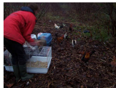
Lothar laat de hanen los

lands Landschap erkennen het dumpen van deze dieren als een serieus probleem. Deze plaats is geen oplossing voor het hanenprobleem in Nederland, het is voor ons een symbool voor de problematiek rond deze dieren. We zullen dan ook altijd de na-